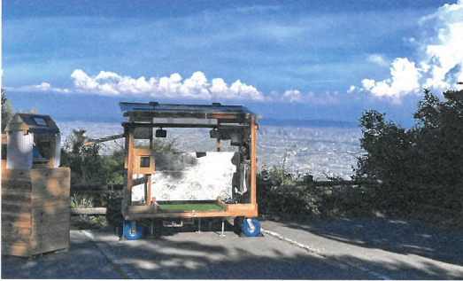
土田翔《移動式直写台》2022-25年